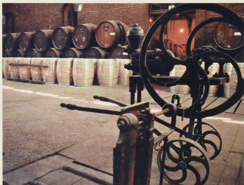
Apuesta futura: Empresas Santa Carolina debiera privilegiar el desarrollo del negocio vitivinícola.

Al respecto, lo que Empresas Santa Carolina necesita, aseguran los analistas, es la incorporación de socios extranjeros bien posicionados en sus campos, que tienen acceso a los últimos adelantos y tendencias y sean capaces de abrir canales de comercialización a gran escala. La otra alternativa es desarrollar una gerencia interna abocada en un 100 % a la labor de mantenerse en la vanguardia, aunque una vez