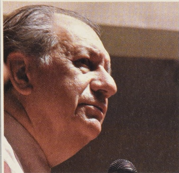
Lagos: personeros ligados a él cuestionaron la realización de cursos de Fernando Flores en el PPD.

perto comunicacional en el PPD. Ello, favorecido por el vacío de liderazgo que se observa en ese partido. "Cuesta creer que un colaborador de Flores, como lo es Sanfuentes, haya ingresado al partido sólo para realizar cursos de capacitación", afirma un dirigente PPD.