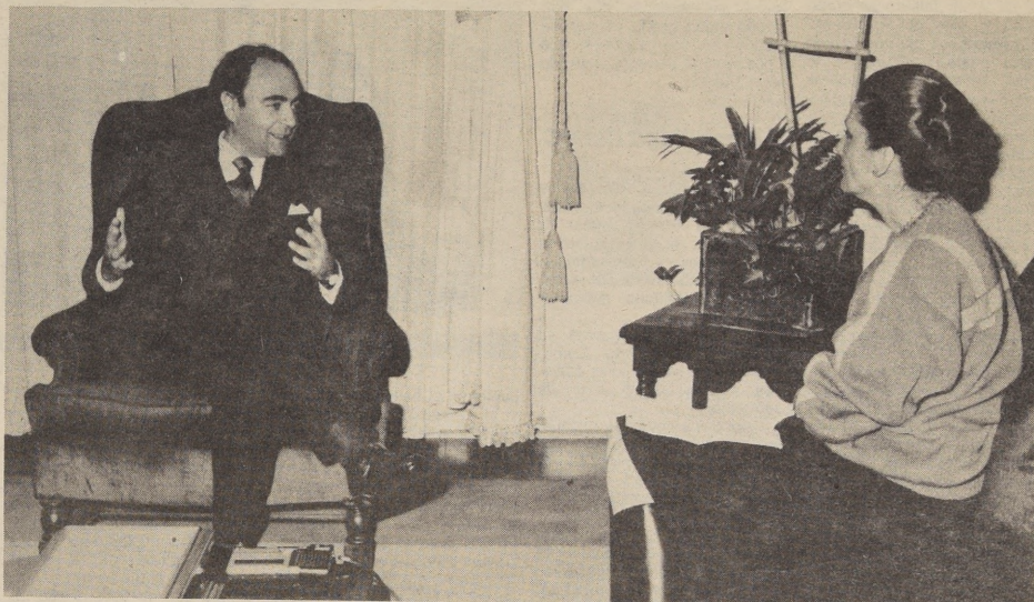
Por María Eugenia Oyarzún