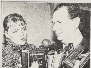
Ricardo Lagos explicó que el Ministerio de Educación legalmente no puede intervenir en las negociaciones entre profesores y sostenedores de colegios subvencionados.

El dirigente gremial celebró que el Ministerio no otorgue la subvención a las escuelas que están en huelga, ni que permita adelantar las vacaciones, "con el gobierno sólo tenemos una controversia sobre el rol que debería asumir el Ministerio en este punto".