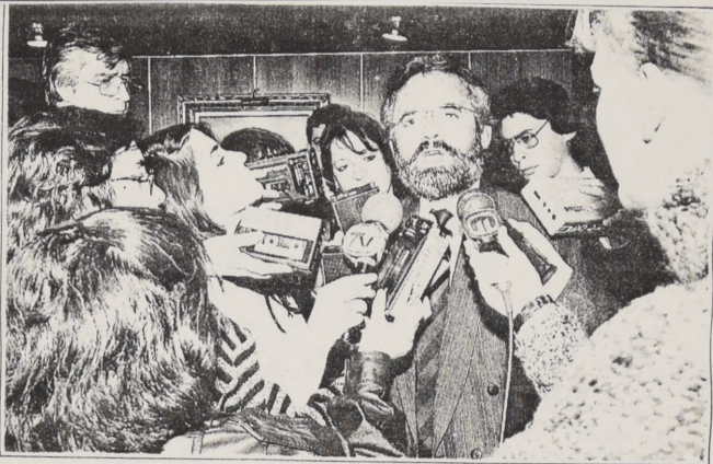
El presidente del Colegio de Profesores, Osvaldo Verdugo, a la salida de la reunión con el Ministro Lagos, indicó que esperaban que los sostenedores dediquen el 75 por ciento de la subvención en favor de salarios de los docentes.

Dicen que 75% de subvención deben ser sueldos