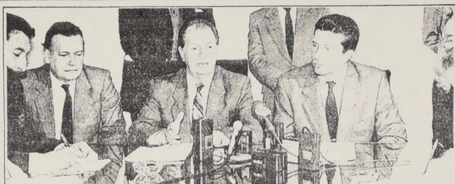
El Ministro de Educación, Ricardo Lagos, y el director general de la Unesco, Federico Mayor Zaragoza, firmaron ayer un acuerdo de cooperación educativa, científica y tecnológica.