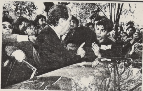
El ministro Ricardo Lagos trata de dialogar con los exaltados que dieron de puntapiés a su automóvil, a la salida del acto en la Universidad Metropolitana.

Al abandonar Lagos el recinto, un grupo de jóvenes provocó desórdenes, produciéndose un intenso forcejeo entre los miembros de los exaltados que, según algunos dirigentes, pertenecen al "Movimiento Juvenil Lautaro".