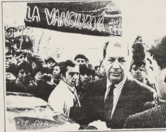
Ricardo Lagos, visiblemente molesto, se apronta a subir a su auto, previo al agravio realizado por un grupo de exaltados, quienes golpearon y escupieron la carrocería del vehículo.

Anunció la creación de un nuevo proyecto universitario y un nuevo estatuto. "Esta es una empresa urgente. Marzo de 1991 debe ser el punto de partida de la nueva institucionalidad, que nos llevará hacia una efectiva proyección