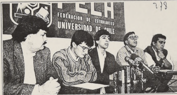
La directiva de la Federación de Estudiantes de la Universidad de Chile dio públicas excusas al Ministro Lagos por la agresión que recibió el miércoles en la U. Metropolitana.