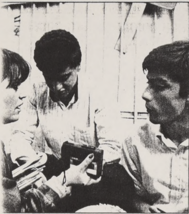
Estar sin clases no preocupa, pero también nos inquieta la situación de nuestros profesores que merecen un trato digno, señalaron alumnos afectados.