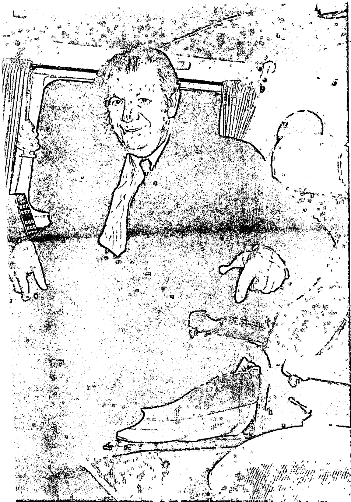
▲ El ministro y "Cosas" en el "Lagos-móvil", un vehículo que es su oficina en las carreteras del país.