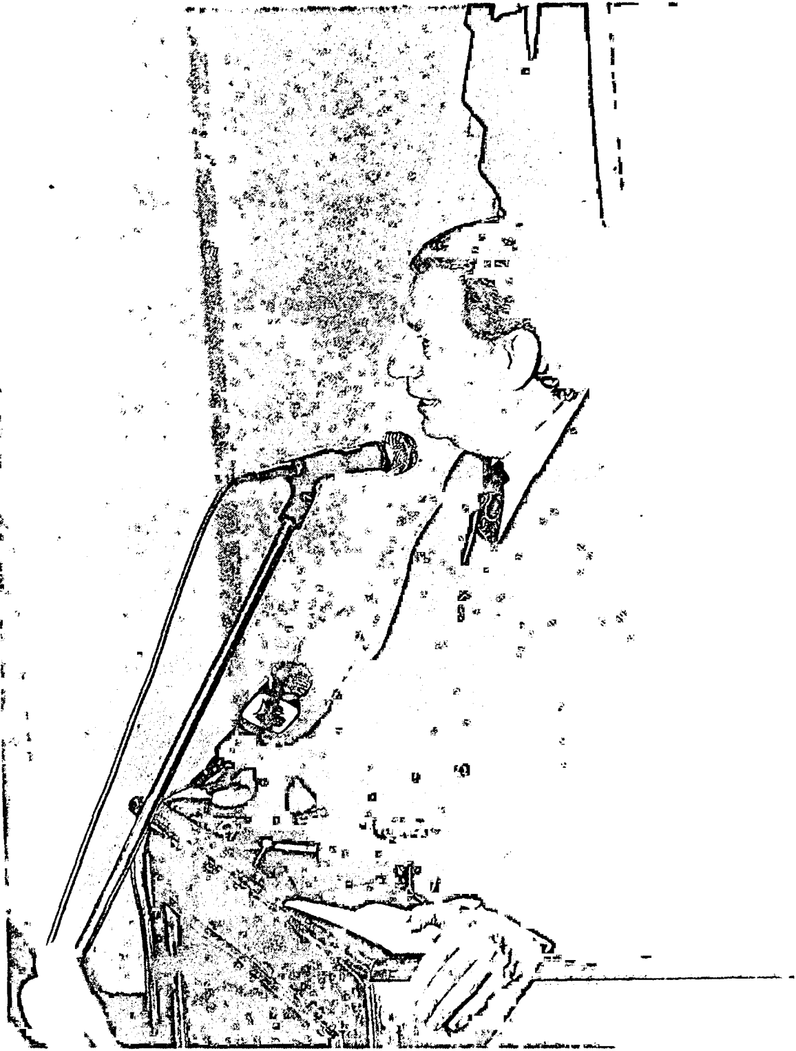
"Nunca he rehuído responsabilidades y eso el país lo sabe".

Eso, a lo menos, conecta a cada oyente con su país. Y, también a la hora de los discursos, se aprecia otro detalle que tiene que ver, quizás, con eso que le atribuyen y que llaman carisma. Ya sea para una multitud o para una persona, Lagos habla de la misma forma: no hace discursos. Expone su pensamiento sin prisas; pero también sin omitir detalle. Agotador tal vez, cuando son tres o más charlas diarias. Pero tiene la gran ventaja de acercarse a cada uno como interlocutor privilegiado. De ahí, una queja que asoma al empezar la entrevista: "Me que-