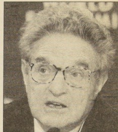
Considerado uno de los hombres más ricos del mundo, George Soros será anfitrión del abanderado.

alianza oficialista tiene programada una reunión con el senador demócrata por Nueva York, Charles Schumer, quien venció en la última elección al senador republicano Alfonse D'Amato, un ácido crítico de Clinton. Lagos regresará al país el domingo alrededor del mediodía.