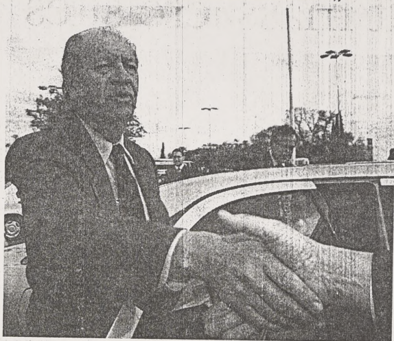
Chilean Socialist Ricardo Lagos, the presidential candidate for the ruling Concertación Democrática, arrives in Buenos Aires yesterday.

But Lagos was full of praise for former President Raúl Alfonsín, who is currently hospitalized in critical condition following a road accident in Río