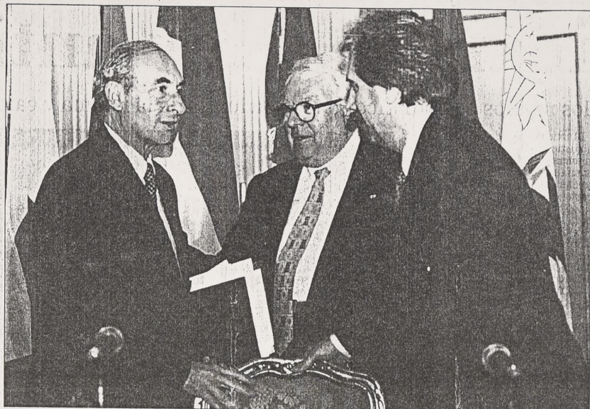
De la Rúa, Mauroy y Vázquez se preparan para la inauguración de la Internacional Socialista