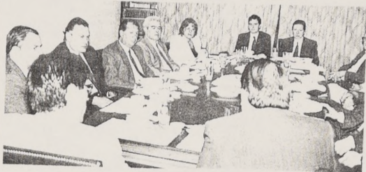
Lagos con directiva de la Confederación de la Producción.

Respecto a la proliferación de universidades privadas dentro del país, el futuro secretario de Estado señaló