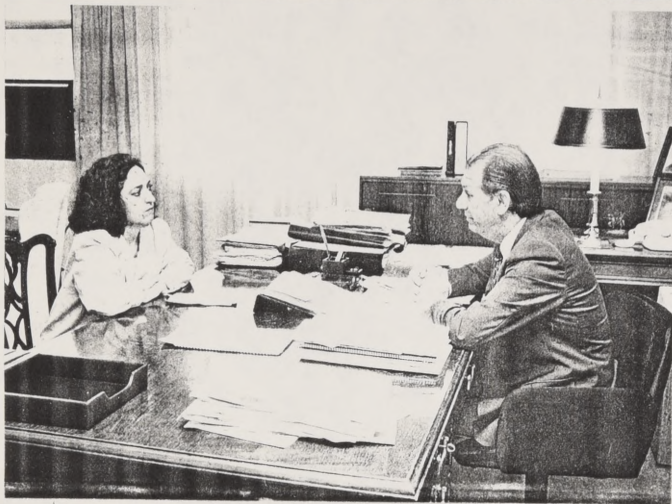
"No me visualizo como un político profesional que haga de la cosa pública una profesión. No es ese mi propósito", señaló Ricardo Lagos a "Cosas".

-No, en absoluto. No me visualizo como un político profesional que haga de la cosa pública una profesión. No es ese mi propósito.