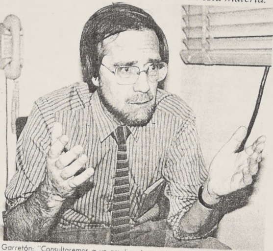
Garretón: "Consultaremos a un amplio número de personalidades del quehacer cultural para conocer su opinión sobre los cinco temas para los cuales se convocó a esta comisión".

Anunció que la comisión iniciará en estos días el envío de un cuestionario