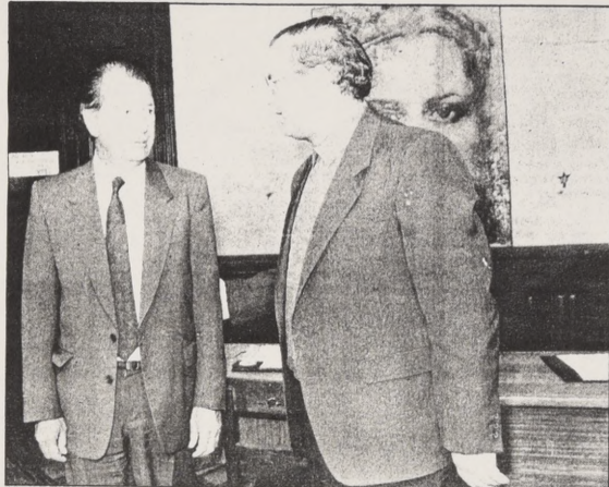
Ricardo Lagos en cordial encuentro con el vicario de la Educación.

La entrevista se gestó a petición de Ricardo Lagos.