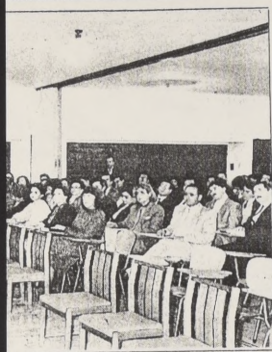
Fue inaugurada ayer la reunión Técnica Nacional de Coordinación del Distancia. El encuentro se prolongará hasta el día 20 de mayo en las 40 Direcciones Provinciales de Educación de las 13 regiones y el Ministerio del ramo, Ricardo Lagos, en la sede de la Secretaría de Estado de Formación de Centros de Alumnos.

El artículo décimo establece que el Centro de Alumnos tendrá asesores pertenecientes al cuerpo docente del establecimiento para orientar el desarrollo de sus actividades y para relacionarlo con el mismo. "Los asesores de los Consejos de Curso serán sus respectivos profesores jefes".