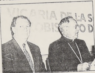
El Arzobispo Carlos Oviedo y el Ministro Ricardo Lagos presidieron la ceremonia.