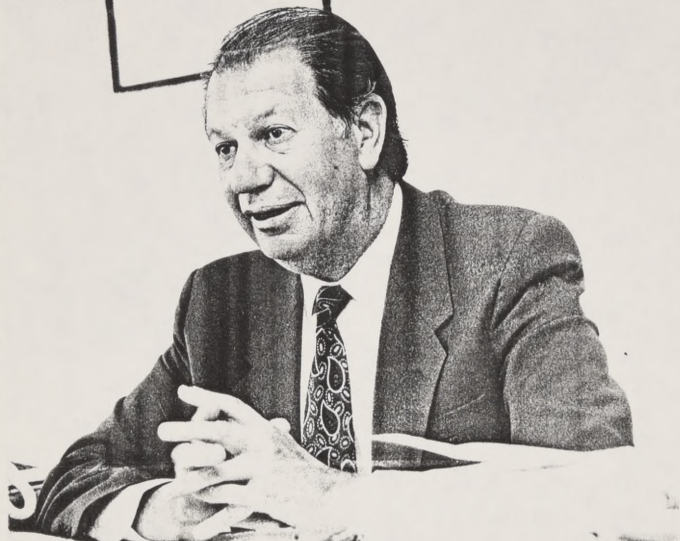
"El país sabe que la elección presidencial es en 1993. ¿Tendría lógica que dejara hoy el Ministerio para ser candidato a qué? ¿A Presidente? ¿Dos años antes?"

re cambiar lo que existe, vota por una opción que signifique ese cambio. Eso es lo que consolida la democracia.