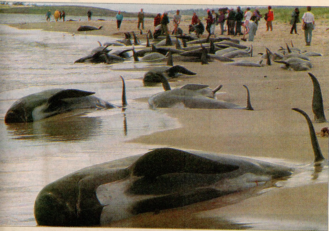
El formulario de Greenpeace a favor de las ballenas habría sido mal utilizado. Organización ecologista también anuncia querrela.

ayamos apoyado campañas de otros por nuestra sensibilidad ambiental. Pero nosotros no hemos organizado nunca una campaña por las ballenas, al menos usado firmas en forma fraudulenta”.