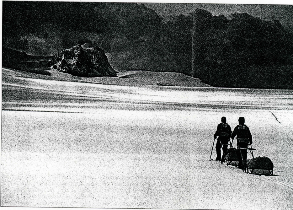
Campo de Hielo Sur o Hielos Continentales, como le dicen en Argentina, fue repartido lo más salomónicamente posible entre ambos países.

El golpe dolió a los chilenos, especialmente a las fuerzas armadas, que están formadas para defender la soberanía nacional. El país ya había perdido un pedazo de