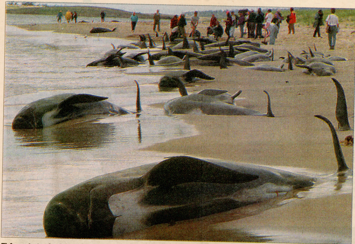
El formulario de Greenpeace a favor de las ballenas habría sido mal utilizado. Organización ecologista también anuncia querrela.

En un inminente enredo de querellas se transformará el reclamo por afiliaciones no autorizadas, que le impidieron votar a unos 15 mil chilenos en las elecciones primarias del domingo pasado.