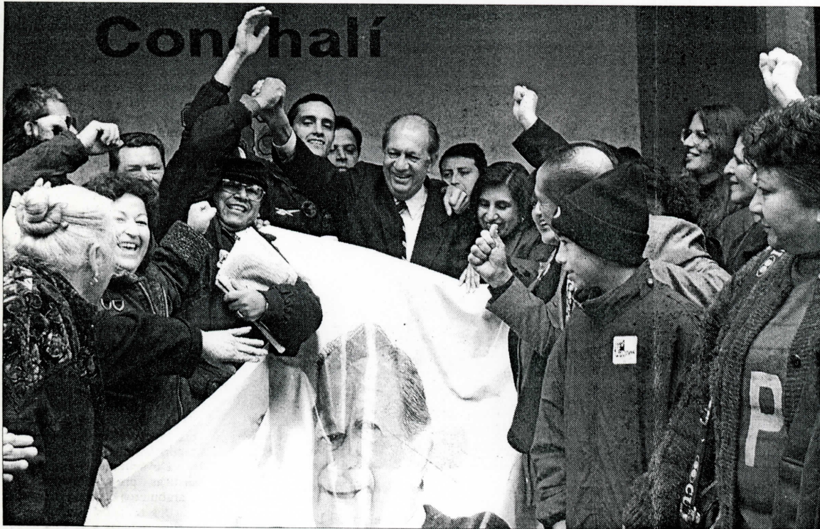
El abanderado de la Concertación está en etapa de agradecimientos a sus votantes. En julio iniciará la campaña presidencial, con el lema "Contrato a futuro".