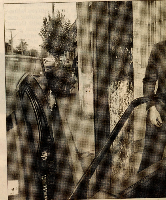
DIPUTADO SIN LICENCIA. — Durante declaraciones ayer ante el juez de Policía Local Cortés Cevalco, luego de la citación que recibió por de Tránsito. En la foto, el parlamentario aborda su del tribunal, no obstante encontrarse sin lice-

El Juzgado de Policía Local de Casablanca ha procesado ante-