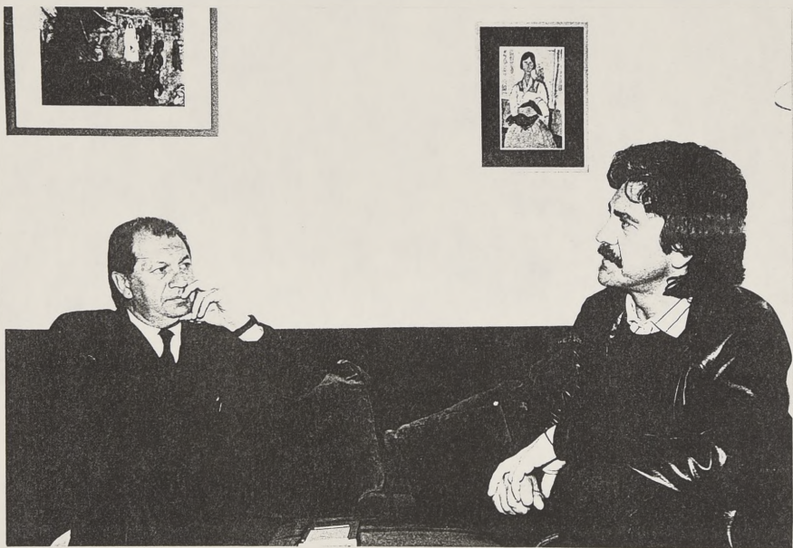
Ricardo Lagos con el autor de la entrevista en Santiago de Chile. Agosto de 1988.