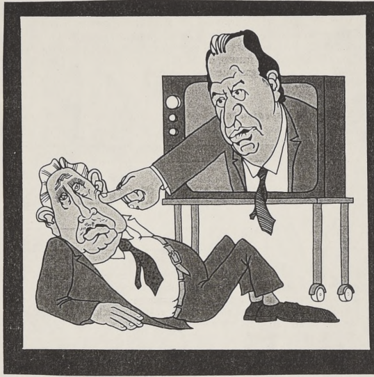
Así se vió en Chile el desafío de Lagos a Pinochet (Caricatura aparecida en revista "ANALISIS" Chile.)