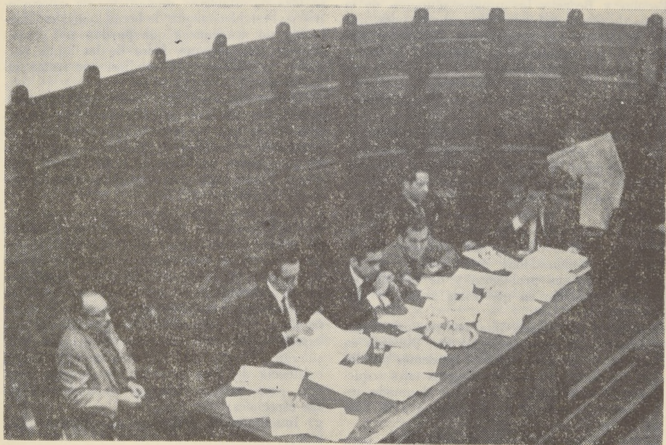
Los Plenarios de la Reforma avanzan en la creación de la nueva Universidad.

En este sentido procederemos en forma inmediata a terminar con las discriminaciones existentes en la Universidad.