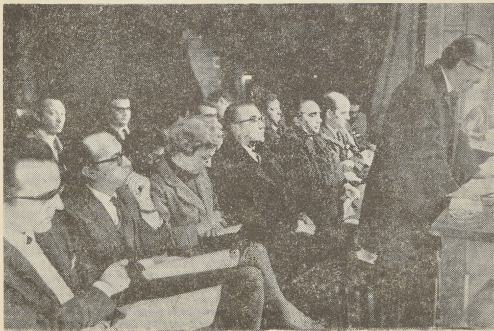
El Congreso de la ADIEX abrió nuevas compuertas a la Reforma.

Creemos necesario que la comunidad universitaria tenga acceso a publicar y comunicar sus programas académicos y comprender a través de la radio, en su tarea cultural, a los grupos mayoritarios de la población. Además, a través de la representación del Consejo Normativo Superior en la Corporación de Televisión de la Universidad de Chile, nos esforzaremos porque ésta realmente traduzca el anhelo de los universitarios de que sea un medio cultural que contribuya a crear opinión pública sobre los problemas nacionales; conciencia crítica.