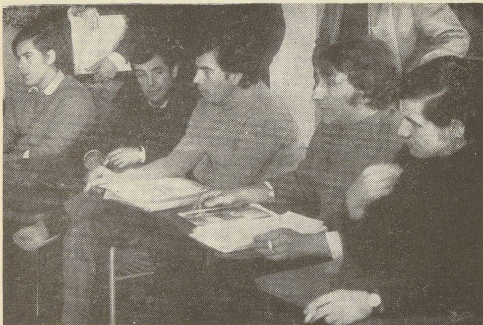
La FECH de Izquierda apura el paso de la Reforma.

REDACTORES: ALEJANDRO ROJAS, Pde. Fech., RAUL OLIVA, MANUEL RIESCO, MARIO FELLNER.