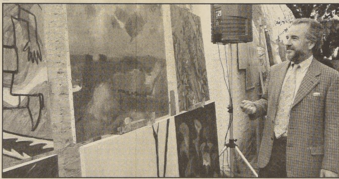
Unos 30 millones de pesos logró recaudar la subasta para Ricardo Lagos.

Sin duda, la lenta reactivación económica que vive el país se reflejó en la timidez con que los interesados al principio levantaron su mano, aunque poco a poco, animados tal vez por el vino blan-