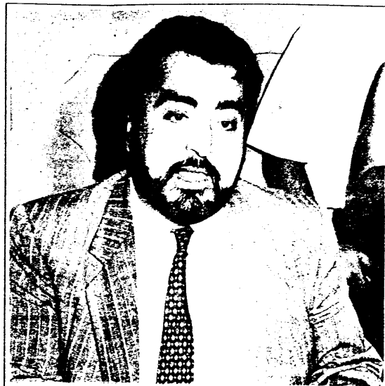
El ministro secretario general de gobierno, Enrique Correa, junto a sus colegas de Interior, Enrique Krauss; Justicia, Francisco Cumplido, y Educación, Ricardo Lagos, estarán presentes hoy en representación del gobierno, en los funerales de las víctimas de Pisagua.

"Existe la necesidad de superar este dolor, enfrentarnos con la verdad, asumir