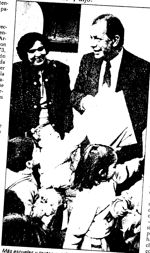
Más escuelas y textos escolares para todos los estudiantes de la educación básica, anunció el ministro Ricardo Lagos.

Respecto al ambiente que se vivió ayer en el país hasta pasado el mediodía, cuando ofreció la conferencia de prensa, reiteró que tal como ocurrió el cuatro, cuando se realizaron los funerales del Presidente Salvador Allende, el ambiente era de plena tranquilidad. “Todo lo que ha ocurrido en estos días ha sido de mucha tranquilidad, no obstante los agoreros. Creo que Chile está cansado de tantos agoreros, los que todavía no se convencer que estamos en un país extremadamente maduro. La lógica de hoy, es muy distinta a la militar de enfrentamiento y violencia. Estos seis meses han sido de una lógica muy distinta”.