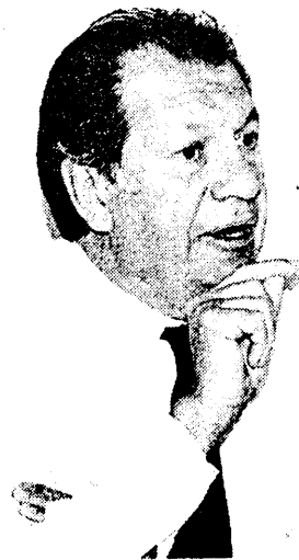
Ministro de Educación, Ricardo Lagos Escobar.

"Creo que Chile observa con paradoja la actitud de algunas personas que hoy día quieren aparecer como víctimas en democracia, en circunstancias que las víctimas se producen en dictadura", afirmó.