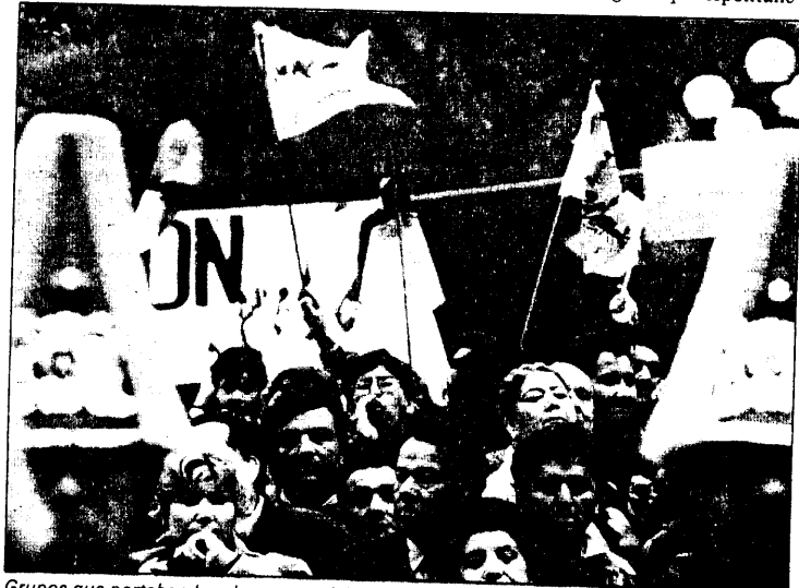
Grupos que portaban banderas especialmente diseñadas se apostaron frente a la Catedral con un solo objetivo: pifiar a las autoridades y aplaudir al general Pinochet.

Contrastaron con el brillo y gallardía de las escuelas matrices de la Fuerza Aérea y Carabineros, apostadas en otros sectores del recorrido presidencial y cuyas interpretaciones musicales fueron muy cuidadas e incluso aplaudidas por el público durante su presentación.