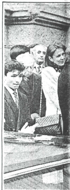
El Ministro de E Catedral, al med reiteradamente, p y enfrentar al unif