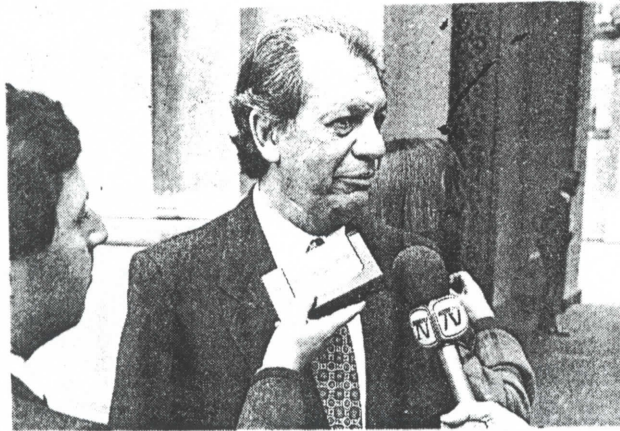
El Ministro de Educación, Ricardo Lagos, se refiere al incidente, a su llegada a La Moneda.

El Ministro del Interior, Enrique Krauss, aseguró que "el ministro Lagos efectivamente informó, tanto al Presidente de la República como a los demás miembros del gabinete, la situación que le correspondió vivir y que es un hecho muy lamentable, doloroso, no para el gobierno, sino para aquella persona que, por ahora en forma relativamente anónima, ha cometido una acción que, sin duda, no ennoblecía el uniforme que aspiraba a servir. Al parecer, es un estudiante de un instituto militar. El Ministro de Defensa, una vez terminadas las Fiestas Patrias, tomará las determinaciones pertinentes, conversando con las autoridades de ese instituto militar".