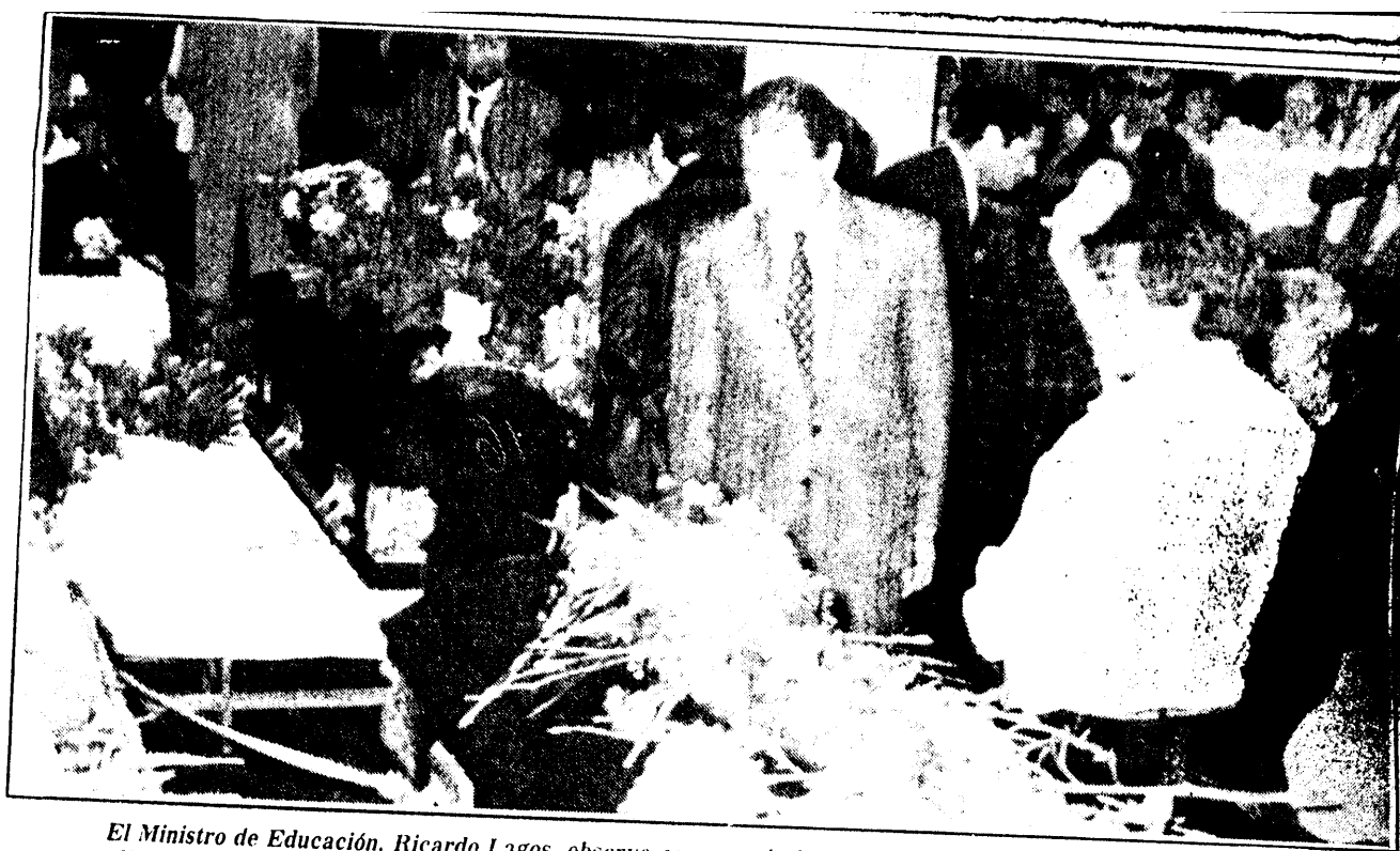
El Ministro de Educación, Ricardo Lagos, observa con recogimiento las urnas de los ejecutados de Pisagua.