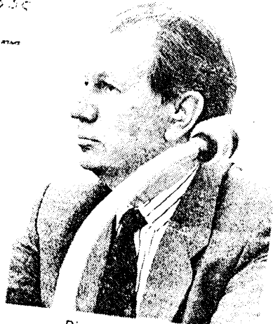
Ricardo Lagos. 278