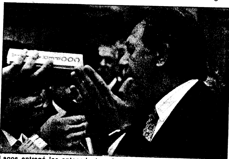
Lagos entregó los antecedentes al ministro de Defensa.

Destacó, sin embargo, que "lo importante es hacerlo de una manera tal, que sea con respeto. Creo que algunos de los grupos que hubo a la salida de la Catedral no representaban la civilidad de este pue-