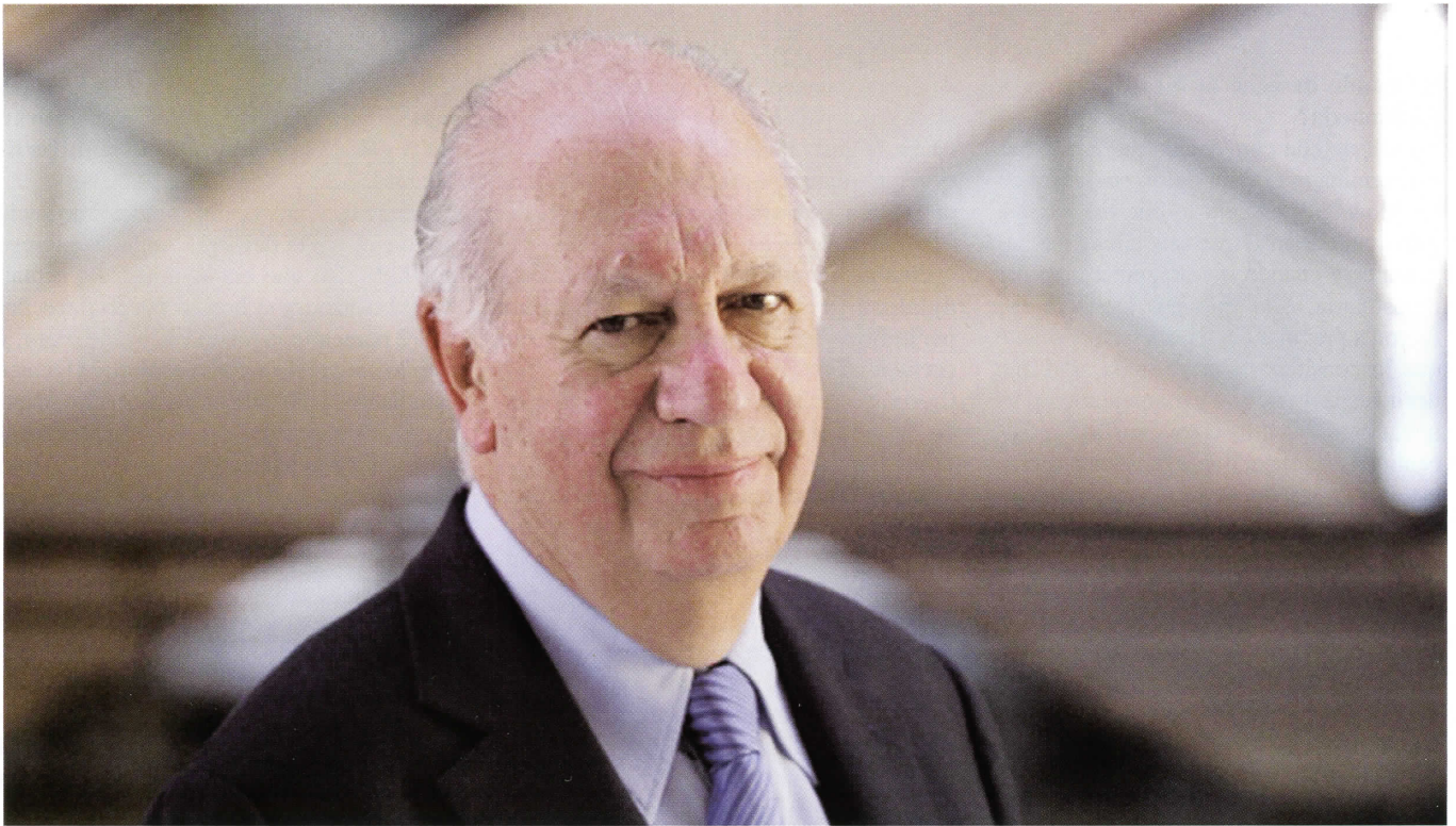
RICARDO LAGOS ESCOBAR