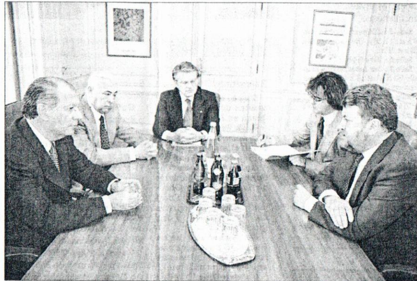
Hier matin le ministre des Travaux publics du Chili rencontrait le ministre des Travaux publics du Luxembourg. La visite marathon de Ricardo Lagos se poursuit aujourd'hui.