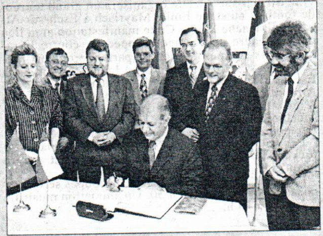
Le ministre chilien, après la capitale, a rendu visite au maire de la cité des roses pour une entrevue amicale.