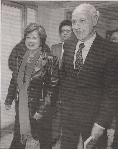
Roberto Lavagna fue ministro de Economía del Presidente Eduardo Duhalde durante su interinato y luego continuó con Néstor Kirchner.

Después de la cita con el ex Mandatario, que duró poco más de una hora, el ex ministro se reunió con Soledad Alvear en la sede del partido, lugar donde recaló que su vínculo con Chile “es histórico”.