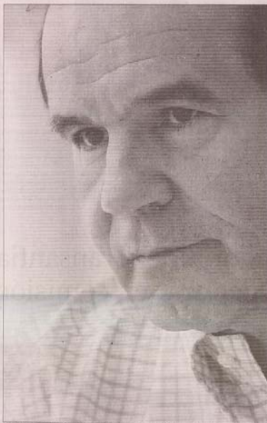
DICHOS.—Con los empresarios, dice, “hay una razonable distancia” y el gabinete funciona “con la lógica de los partidarios, a cuchillazos”.

—¿Resalta algún ministro político? —Lo único rescatable del equipo político de la Moneda son las buenas intenciones del ministro Viera-Gallo. El ministro del Interior no opera como jefe del gabinete y cualquier comparación con sus antecesores, lo deja en evidente