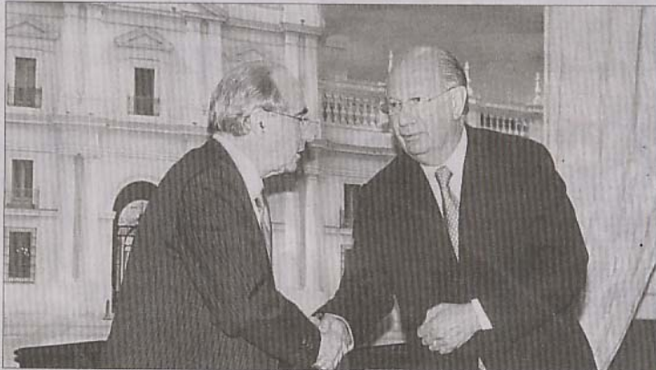
LA MONEDA DE FONDO. — Aunque hace un año el presidente del PPD, Sergio Bitar, desestimó que Ricardo Lagos repostulara, ayer levantó la opción del ex gobernante.

veniente lanzarse en picada contra Lagos, debilitarlo, no sólo ante la eventualidad de que fuera candidato, sino para dañar la imagen de su gobierno y la proyección estratégica del progresismo moderno de América Latina que encarna”, dijo entonces.