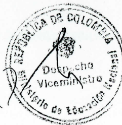
RAFAEL ORDUZ MEDINA Viceministro de Educación Nacional