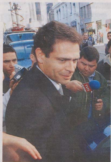
CIENFUELOS / P. JACQUEL

La ministra, en tanto, defendió ayer su resolución: “Simplemente yo cumplí con el mérito del proceso”. Consultada por el plazo de las condenas, explicó que consideró “una atenuante como muy calificada y se aplicó la institución de la media prescripción”. Las atenuantes fueron, colaboración con la investigación, en el caso de Cortés, e improbable conducta anterior, en el caso de De la Fuente.