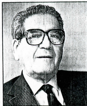
Enrique Silva Cimma, Ministro de Relaciones Exteriores:

* Le ha faltado estatura política por lo que le sobra en dimensión física. Se muestra débil por aparecer justificando a la izquierda.