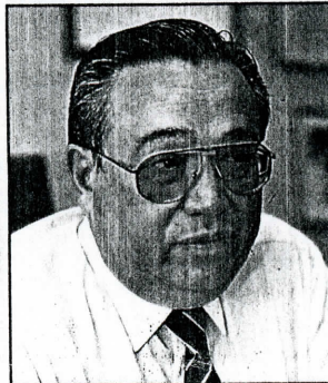
Enrique Krauss, Ministro del Interior:

Tal vez por eso es que los integrantes de la comisión evaluadora decidieron tranquilos, sin sesgo político. Calificaron todos, como profesores críticos. Es decir, no siempre la derecha fue mezquina en las notas, ni los gobiernistas generosos.