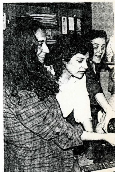
Los periodistas rodean al televisor que ofreció una conferencia de prensa.

En el caso extremo de que haya dos candidatos de la Concertación ¿Ud. cree que el presidente Aylwin vaya a hacer un ajuste ministerial y Enrique Correa deje de ser su vocero? No. La Concertación va a seguir caminando y en consencuencia no cabe la menor duda que tendremos gobierno de Concertación ahora, con el presidente