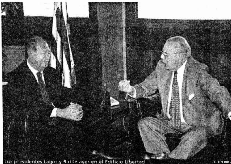
Los presidentes Lagos y Batlle ayer en el Edificio Libertad

Las buenas noticias comenzaron a conocerse el miércoles, cuando la Dirección de Servicios Ganaderos informó que desde ayer está entregando certificados de exportación de productos lácteos con destino a Argentina, Brasil,