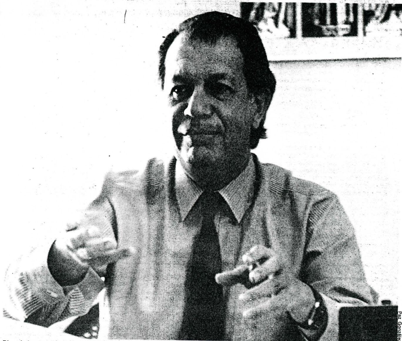
Ricardo Lagos: "Aquel partido que quiera presentar candidato propio va a ser penalizado por este país"

personales por ninguno de los demócrata-cristianos porque me parecía que eso era interferir en un problema interno. Pero, como dijo Tomic, habría preferido que propusieran varios nombres a la Concertación.