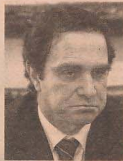
Hernán Larraín, senador UDI.