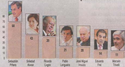
¿Quién será candidato el 2009?

Según la directora de MORI, "los candidatos presidenciales óptimos deberían ser Alvear, Piñera, Insulza y Van Rysselberghe, porque no tienen negativos que perjudiquen su imagen".