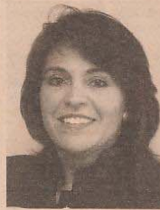
Ana Lya Uriarte, ministra de Medio Ambiente.