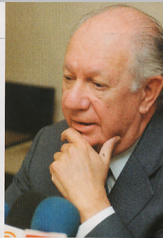
Ricardo Lagos: "Siempre listo".

En la DC se estima que las condiciones objetivas del PDC son ahora favorables a Soledad Alvear, ya que se logró imponer sobre el sector más temible como adversarios los colobos. Estos aparecen hoy en minoría y hasta se llegó a especular que hacer ante la posible espoliación de la DC del senador Adolfo Zaldívar, pero da la impresión que la sangre no llegará al río y en definitiva a Zaldívar se le aplicará una