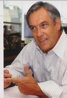
Sebastián Piñera: "Las multas no son mi problema".

Las mentes más cerebrales de la Concertación captan que en la próxima pasada el candidato debe ser militante de la DC para salvar a la Concertación. Nadie olvida que la Democracia Cristiana trabajó y votó en las dos últimas elecciones por un candidato presidencial del mundo socialista-PPD.