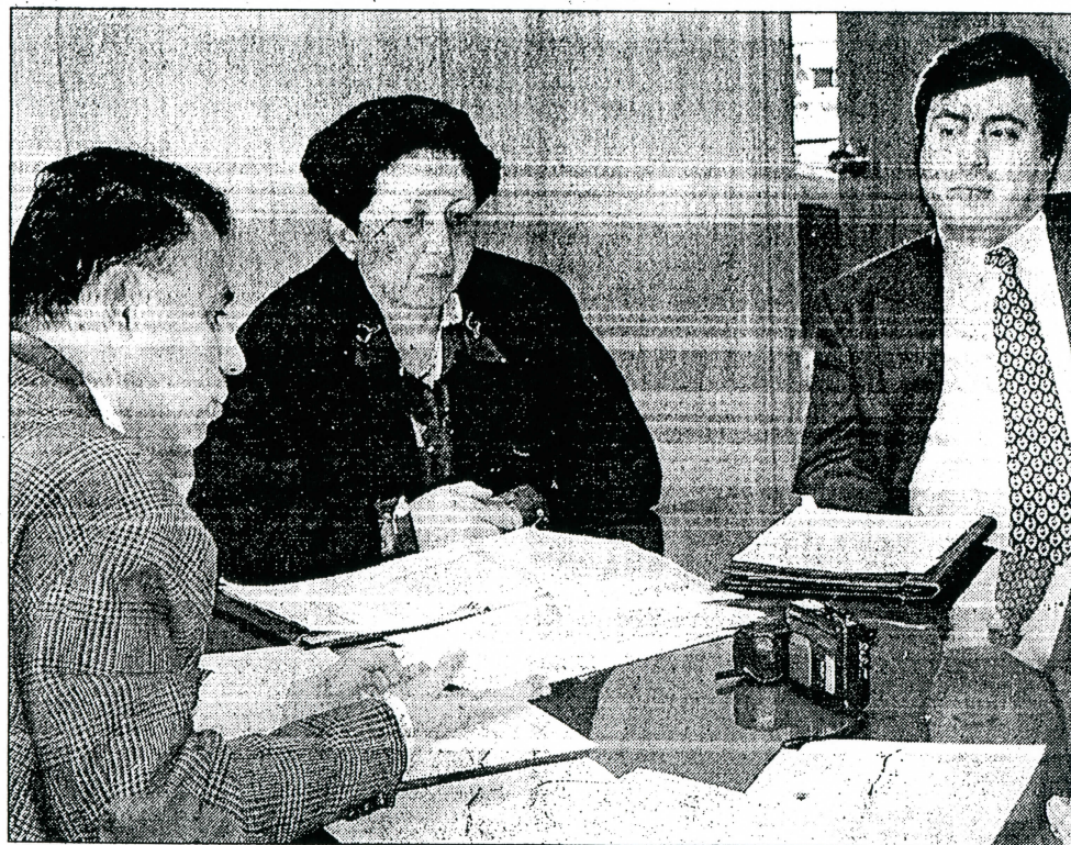
Las autoridades del Ministerio de Obras Públicas llamaron a los parlamentarios a respaldar la gestión ministerial "que está actuando en estricto apego a la ley".

Dificultades similares se registran en la zona donde se construye la Carretera de la Costa, específicamente en el tramo Tirúa—Tranapunte que se extiende por unos 50 kilómetros y donde deben expropiarse 186 lotes, un 5% de ellos correspondiente a familias mapuches. Allí el proceso de expropiaciones "ha seguido el curso normal y si