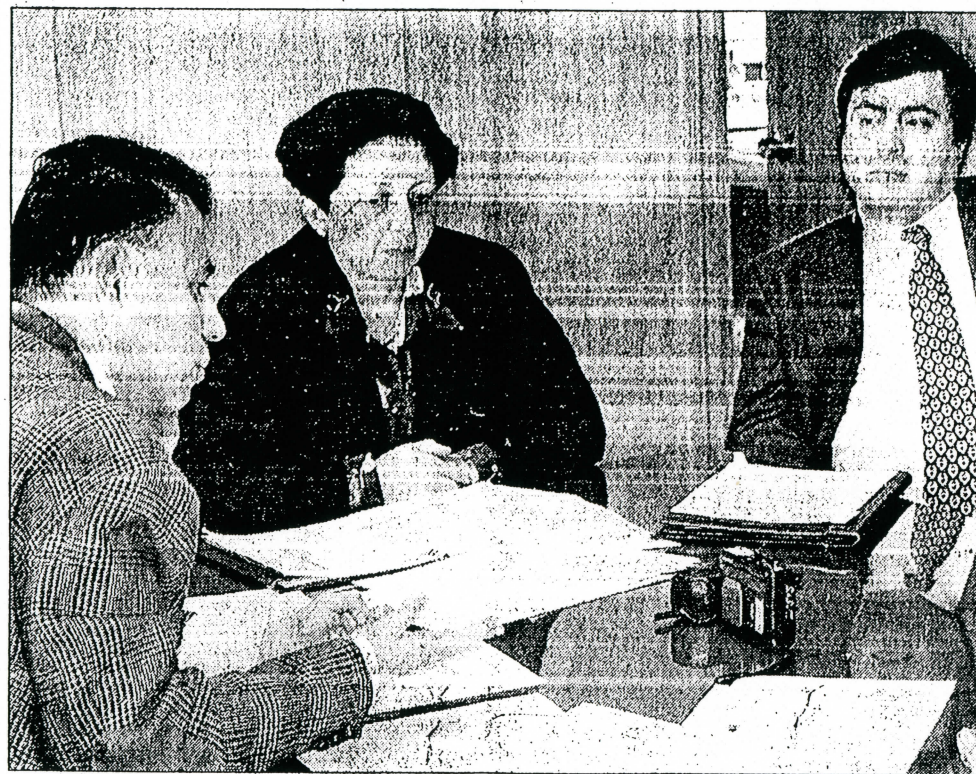
Las autoridades del Ministerio de Obras Públicas llamaron a los parlamentarios a respaldar la gestión ministerial "que está actuando en estricto apego a la ley".

Dificultades similares se registran en la zona donde se construye la Carretera de la Costa, específicamente en el tramo Tirúa—Tranapunte que se extiende por unos 50 kilómetros y donde deben expropiarse 186 lotes, un 5% de ellos correspondiente a familias mapuches. Allí el proceso de expropiaciones "ha seguido el curso normal y si