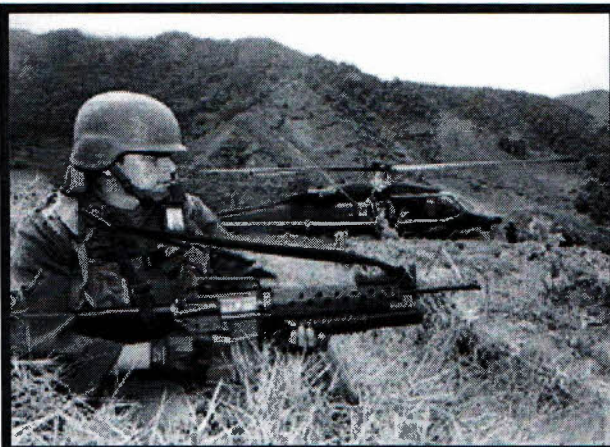
Bogotá, Colombia, diciembre.- La fotografía de archivo muestra a un militar colombiano que monta guardia frente a un helicóptero.

“Es algo en lo que seguiremos trabajando”, agregó el vocero al responder a las consultas sobre el malestar expresado recientemente por el gobierno de