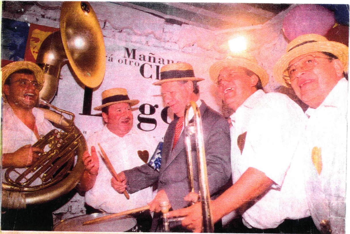
El candidato PS-PPD-PRSD en su cumpleaños político, realizado en su comando. Con desplante y usando sombrero se atrevió a tocar la batería junto a la banda "Poli-jazz".