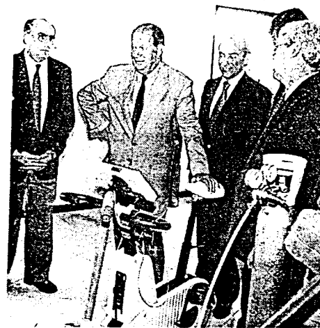
El ministro Ricardo Lagos entregó hoy a las autoridades de Digeder las dependencias del Centro Polideportivo de Alto Rendimiento.

"mayor eficiencia en el uso de los recursos" y admitió que en algunas obras es necesaria la contratación de "mayor personal y mucha gente a honorarios", pero recalcó que todos los contratos